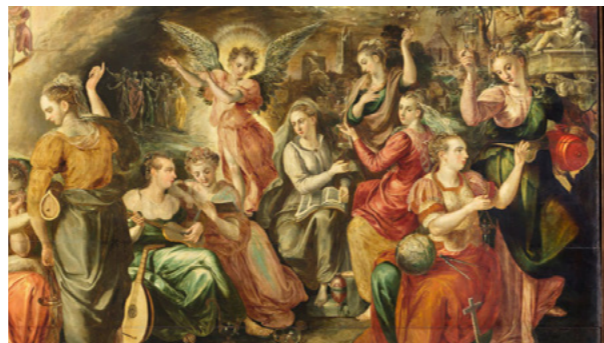
Les vierges sages et les vierges folles par Martin de Vos

Et le mot traduit par « sage » (phronimos) en fait signifie littéralement « intelligent ». Voilà aussi qui est important. La foi n'est pas opposée à l'intelligence ni à la raison. Au contraire. La foi n'est pas de croire aveuglément ce qui semble « absurde » ou mystérieux. On peut même découvrir Dieu par l'intelligence.