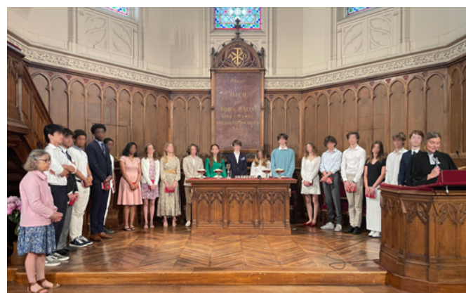
19 catéchumènes confirmant à l'Étoile en 2023

les dimanches 15 octobre, 19 novembre, 17 décembre (culte de Noël des enfants), 14 janvier, 4 février, 10 mars, 5 mai, 2 juin (culte des confirmations)