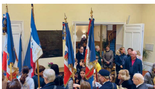
Cérémonie du Souvenir