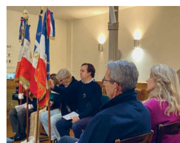
Culte du Souvenir