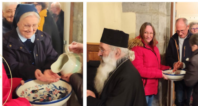
Partage biblique et célébration œcuménique le 24 janvier 2024 à Semur-en-Auxois dans une petite chapelle catholique.