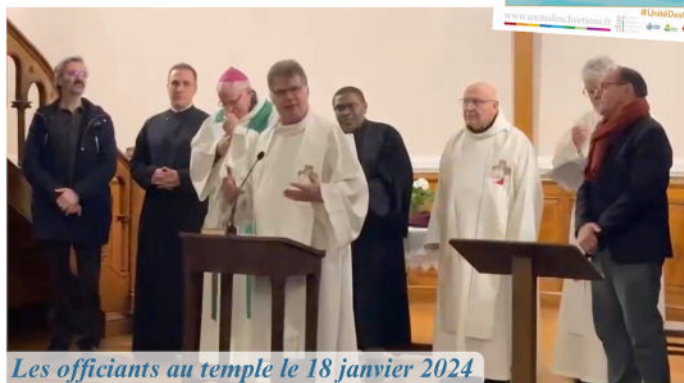
Les officiants au temple le 18 janvier 2024