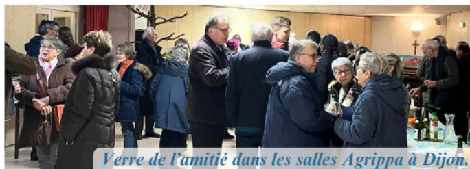
Verre de l'amitié dans les salles Agrippa à Dijon.