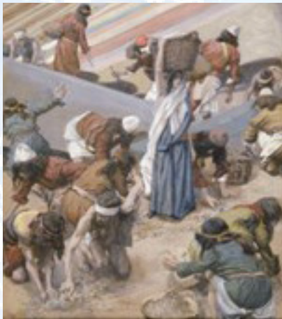
La récolte de la manne de James Tissot (1896-1902)

Après la cérémonie, vint un temps d'échanges sur engagements écologiques et foi, avec présentation d'A Rocha (organisation internationale chrétienne de protection de l'environnement), d'actions municipales, des cleans wokers, et aussi d'actions individuelles.