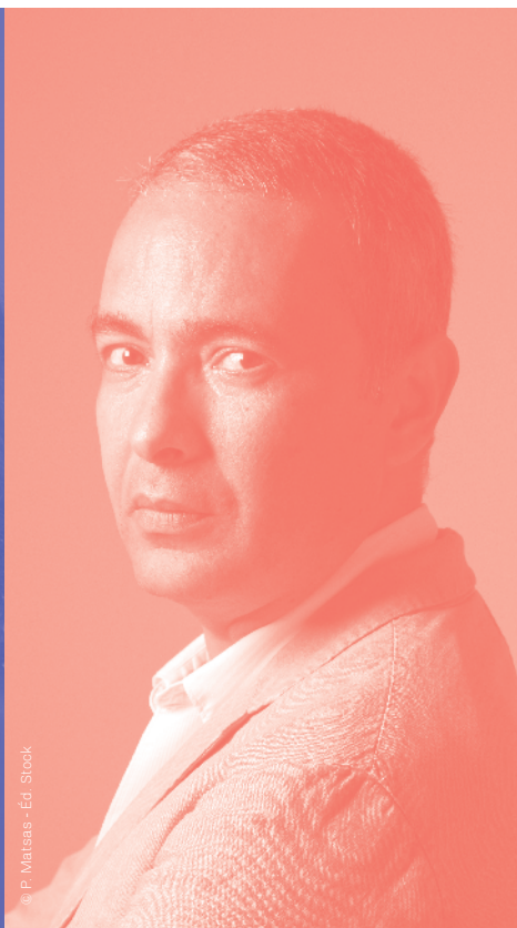
© P. Mateas - Ed. Stock