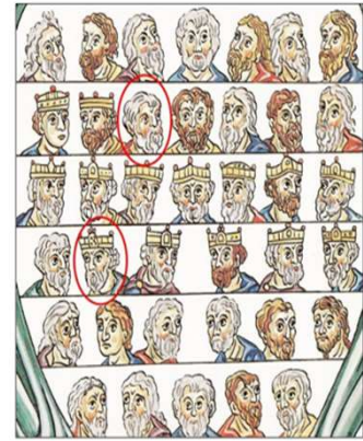
La généalogie du Christ selon l'Hortus Deliciarum (XII es .)

Il n'échappera pas à son destin, il est l'aboutissement inéluctable du désir conjoint d'un peuple, d'une famille et d'une certaine idée de Dieu. Et cependant, comptez et recomptez la liste des générations de la généalogie de Matthieu.