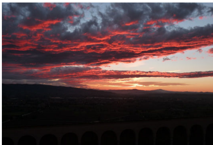
Ciel du soir sur Assise

Chaque année en septembre et octobre, des chrétiens du monde entier accordent une attention particulière au thème de la création, avec deux aspects complémentaires : tout d'abord, louange et action de grâce envers Dieu pour la beauté et l'abondance de la création, et l'immesité de son amour pour elle. La notion de création, à la différence de celle de nature, insiste sur ce lien originel avec un Dieu Créateur. Ensuite, c'est l'occasion de nous rappeler la responsabilité que Dieu nous confie pour prendre soin de cette création, et de réfléchir à nos rapports avec le reste du vivant. Le Temps pour la Création 2024 est intitulé plus précisément « Espérer et agir avec la Création » et s'appuie sur un passage de l'épître aux Romains (8,19-25). International et œcuménique, le Temps pour la Création va officiellement du 1 er septembre, jour de prière pour la sauvegarde de la création, d'initiative orthodoxe, jusqu'au 4 octobre, fête catholique de François d'Assise, saint patron de l'écologie. C'est la première année que notre paroisse rejoint la dynamique, avec un riche programme qui s'étendra jusqu'en octobre.