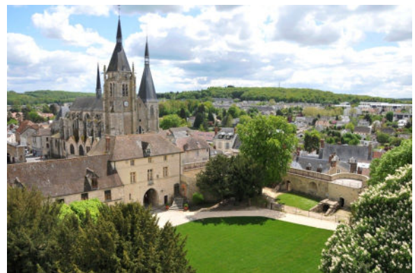
Dourdan, un site médiéval au sud de Paris. Château du XIII siècle et Église du XII siècle